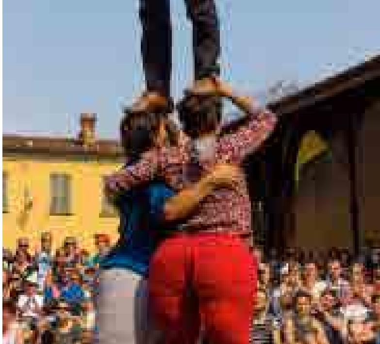
Et si on marchait sur la tête ?

Nous nous intéressons aux relations porteur-voltigeur. Au lieu de proposer une relation unidirectionnelle où le porteur, l'homme fort, fait décoller tour à tour l'une ou l'autre des voltigeuses, nous voulons proposer d'autres visions :