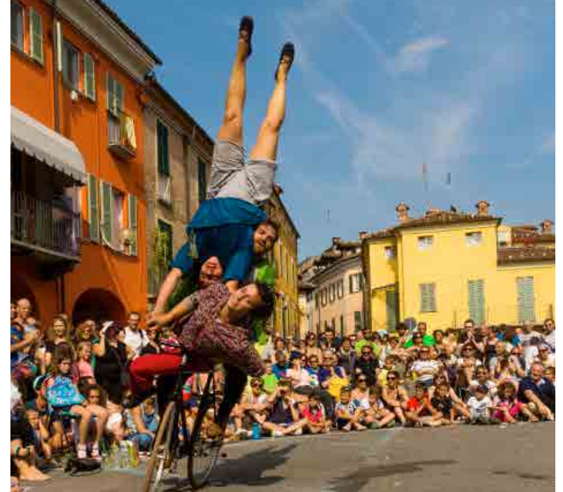
Et si on pédalait les jambes en l'air?

Nous refusons de nous restreindre à l'évidence créée par nos gabarits et nous voulons utiliser les portés acrobatiques pour créer également des images décalées.